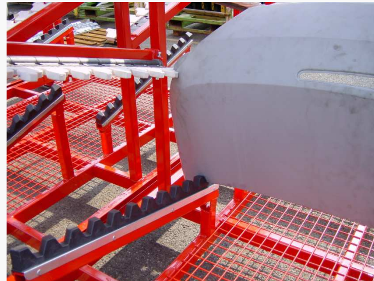
➤ Panneau de porte de coffre